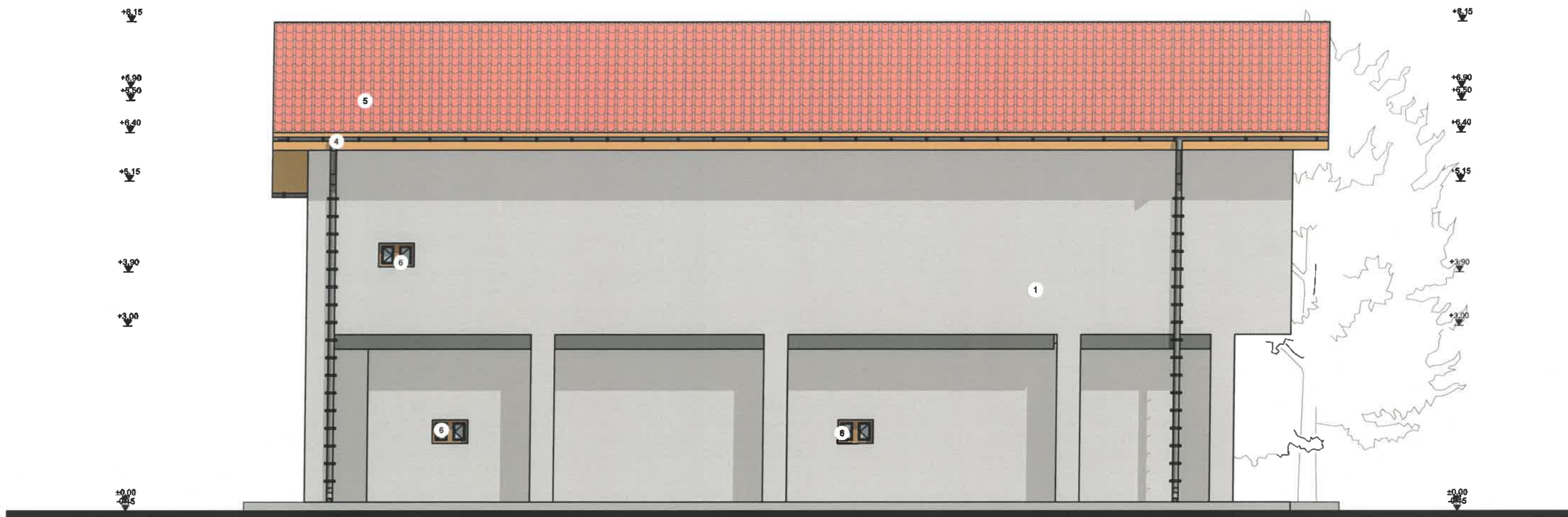
FATADA LATERALA STANGA